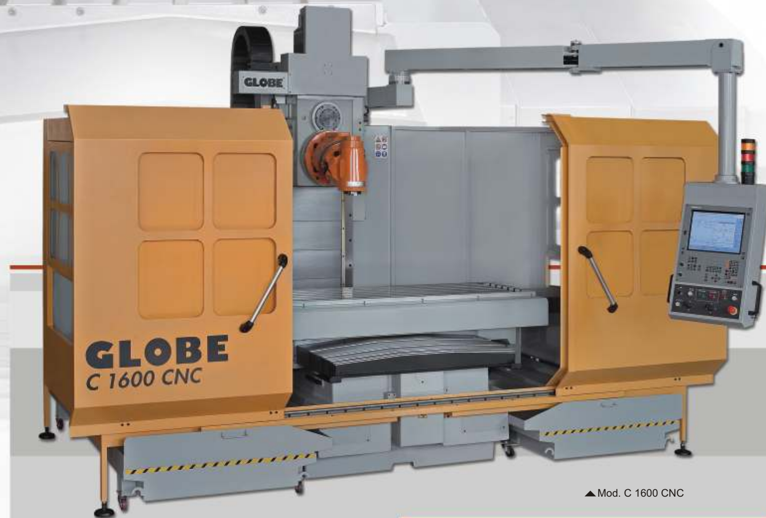
▲ Mod. C 1600 CNC