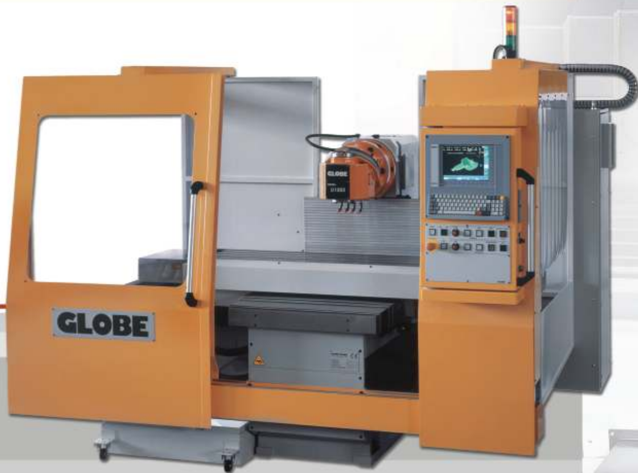
▲ Mod. C 1200 CNC

Grazie alle guide di scorrimento molto ampie, alla conformazione del basamento ed alla robustezza della sua struttura, le fresatrici a banco fisso con tavola a croce della serie C 1200/1600/2300 CNC offrono caratteristiche di rigidità e stabilità difficilmente riscontrabili in fresatrici delle stesse dimensioni. Il montante molto compatto, con numerose nervature interne, ha le guide di scorrimento molto lunghe e ben dimensionate.