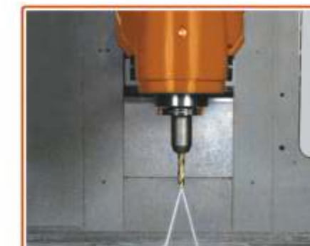
▲ PASSAGGIO LIQUIDO REFRIGERANTE ATTRAVERSO IL MANDRINO