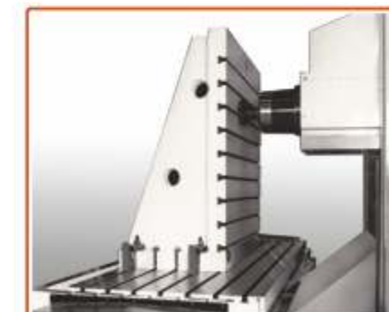
▲ SLITTONE CON MANDRINO ORIZZONTALE

Questa serie di fresatrici a banco fisso si distingue per le eccezionali caratteristiche di robustezza e rigidità.