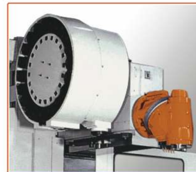
▲ CAMBIA UTENSILE AUTOMATICO A RUOTA A 12, 20, 24 POSTI