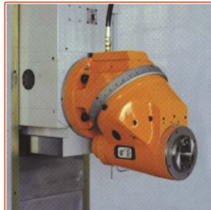
▲ TESTA AUTOMATICA A 2 POSIZIONI (verticale-orizzontale), LA PARTE POSTERIORE PUO' ESSERE ORIENTATA MANUALMENTE