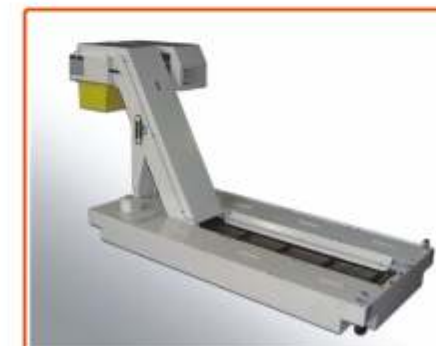
▲ TRASPORTATORE DI TRUCIOLI A TAPPETO