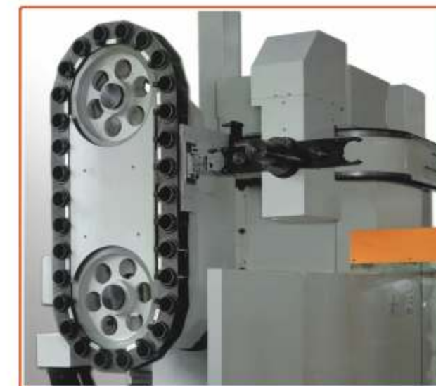
▲ CAMBIA UTENSILE AUTOMATICO A CATENA A 30, 40, 50, 60 POSTI